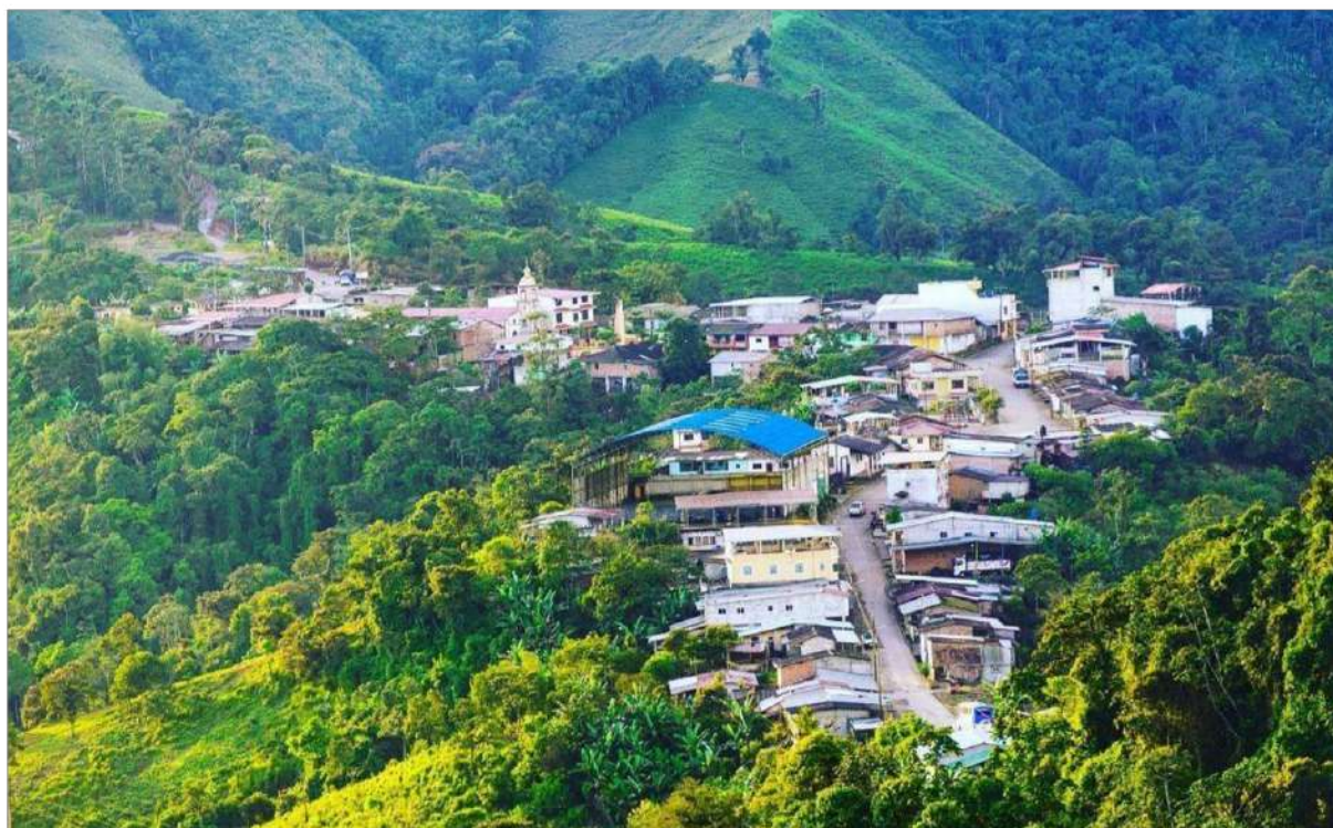
Imagen 2. Panorámica de la parroquia El Limo