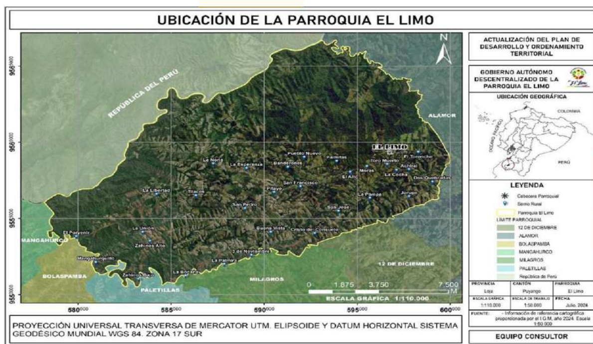
Mapa 1. Ubicación de la parroquia el Limo

Fuente: Cartografía IGM, 2024 Elaboración: Equipo consultor 2024