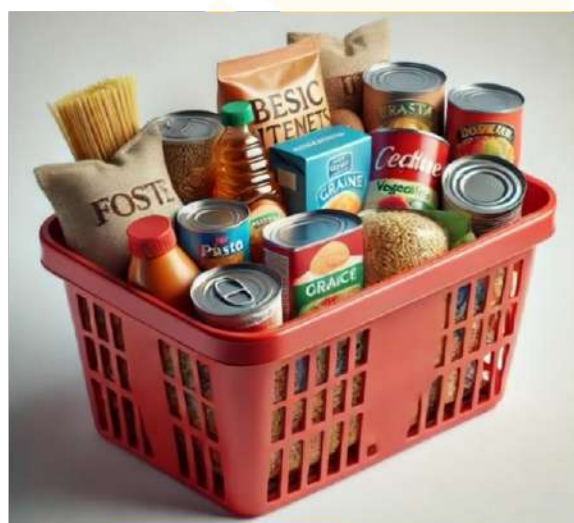
Imagen 3. Kits de ayudas humanitarias